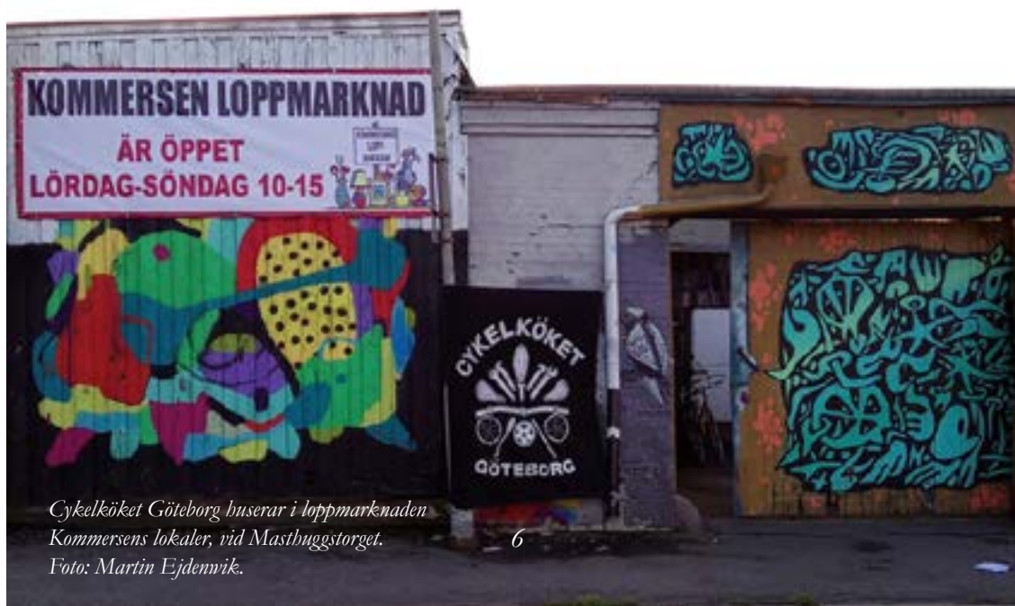
Cykelköket Göteborg buserar i loppmarknaden Kommersens lokaler, vid Mastbuggstorget.

Det finns en stor variation av drifts- och organisationsformer bland de sex cykelkök som i skrivande stund, februari 2019, är aktiva i Göteborg. Vissa cykelkök drivs av enskilda medbor-