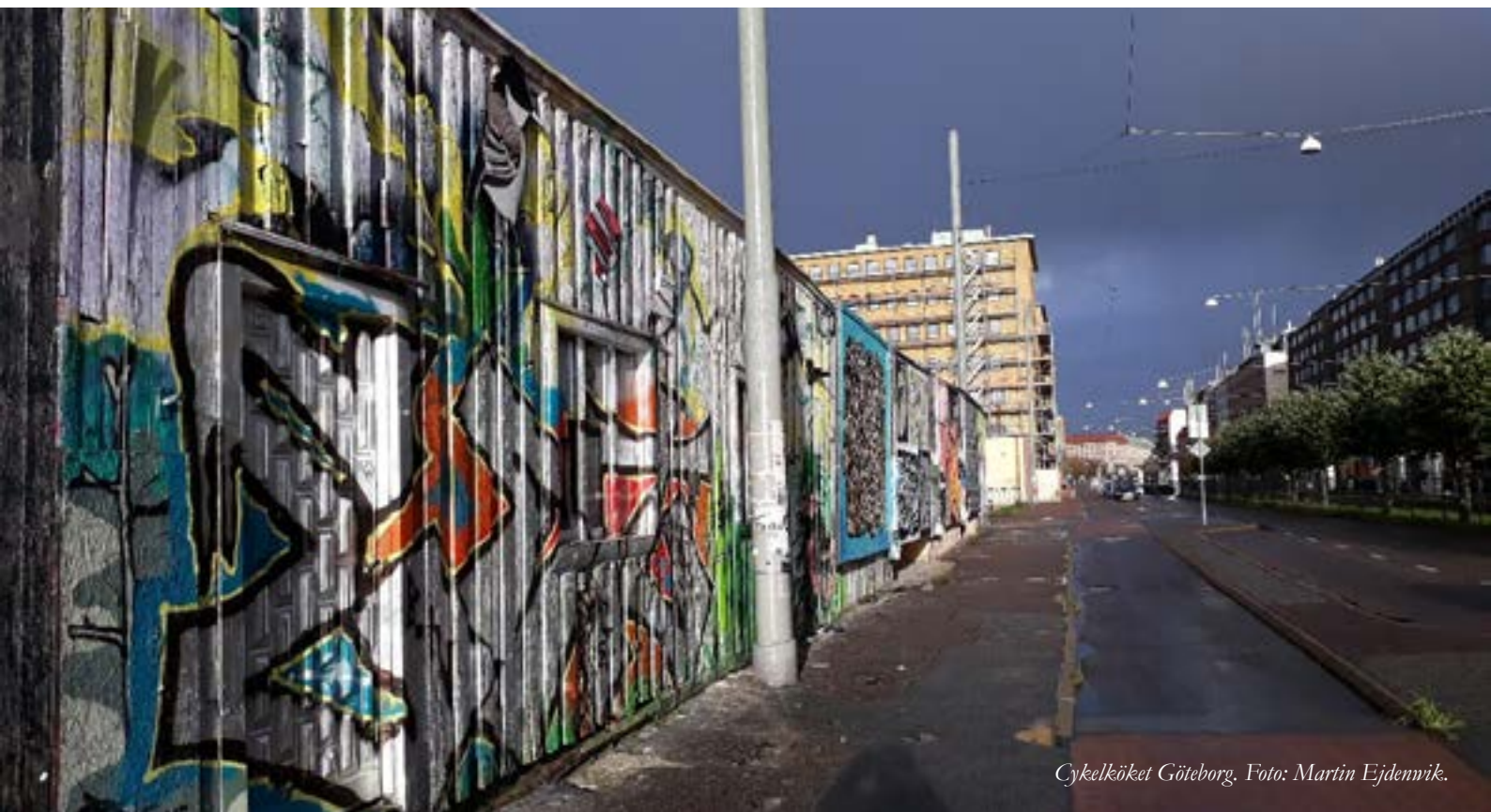
Cykelköket Göteborg.