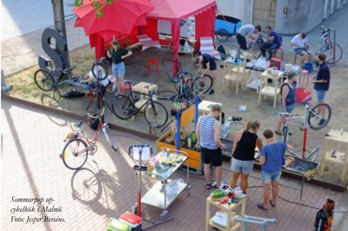
Sommarpop upp- cykelkök i Malmö.

"Fallgroparna i början handlade mycket om att vi inte visste hur många cyklar vi skulle få in. På grund av att vi delade ut cyklar gratis var det enormt hårt tryck på verksamheten i början."