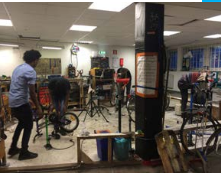
Cykelköket Göteborgs tidigare lokaler på Vegagatan.