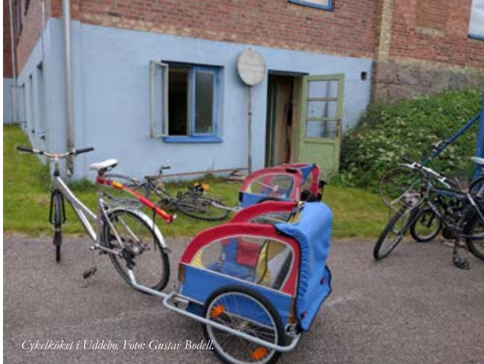
Cykelköket i Uddebo.