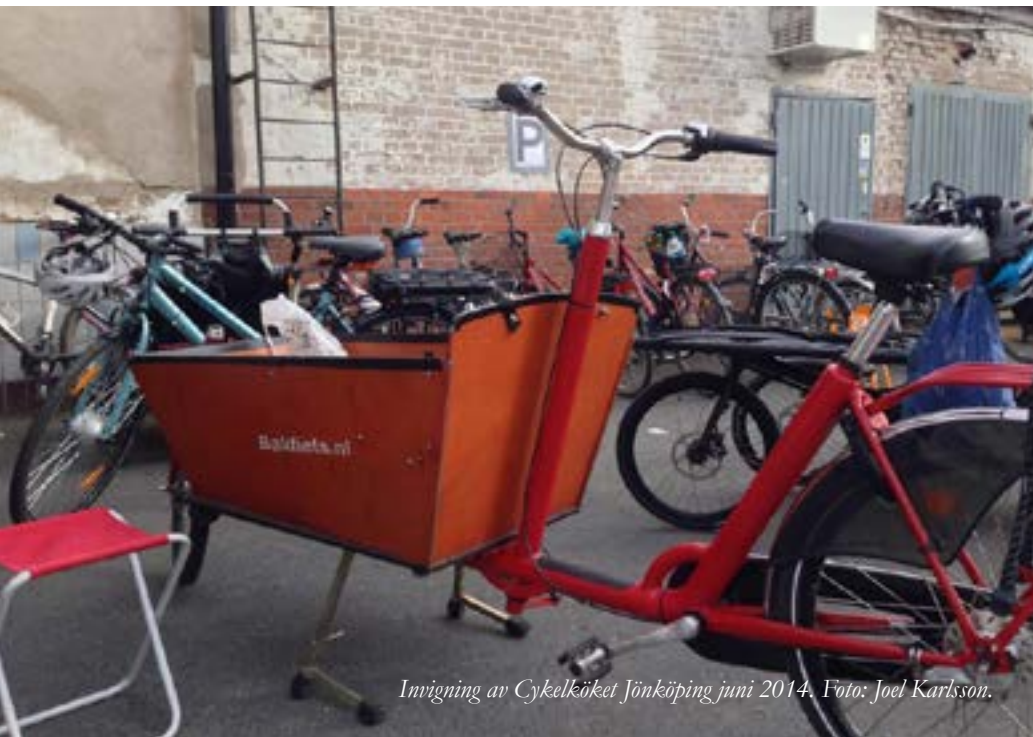
Innigning av Cykelköket Jönköping juni 2014.

"Efter lång tids lobbyarbete har vi nu en god försörjning av skrotcyklar, främst från kommunens parkeringsavdelning som tidigt var med på banan."