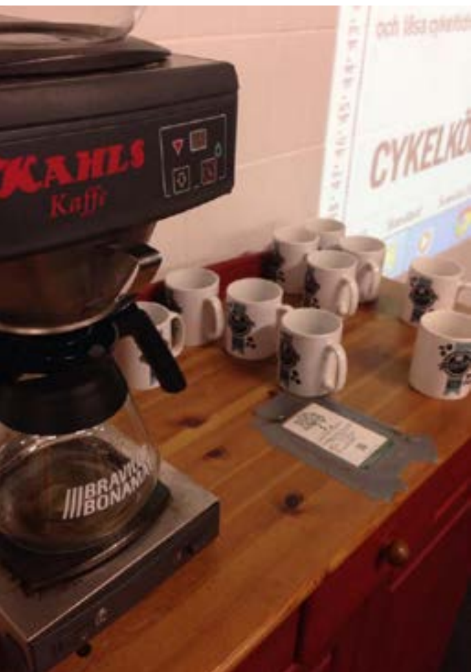
Cykelkökskaffe på cykelköket i Jönköping.

För att lokalen ska vara funktionell behöver det även finnas en toalett med handfat där det går att tvätta händerna ordentligt.